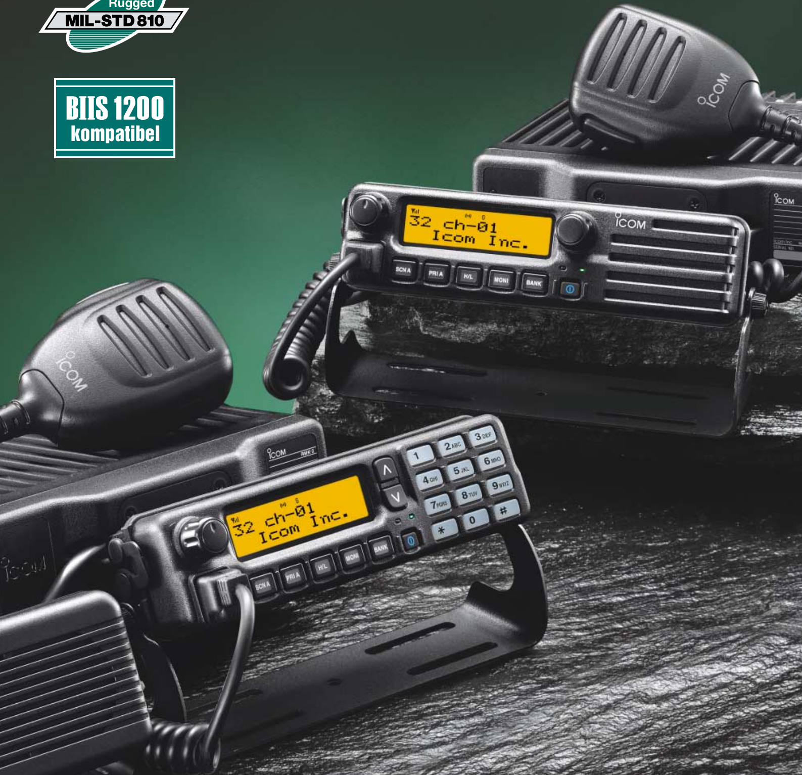
Abbildung mit optionalem Separationskit RMK-2 und Separationskabel OPC-609